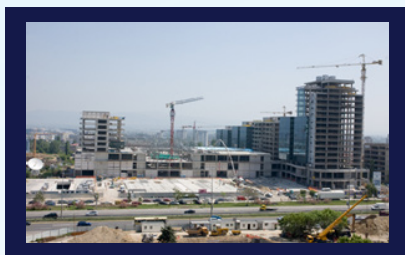
Хермес Парк – гр.София