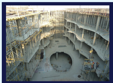
МОЛ България – гр.София