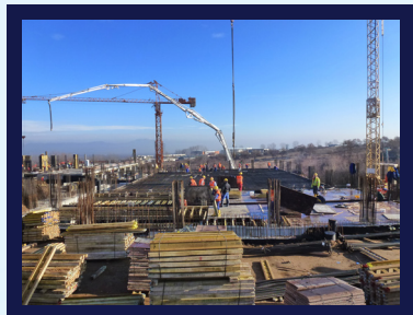
Американско-Английска Академия – с.Лозен